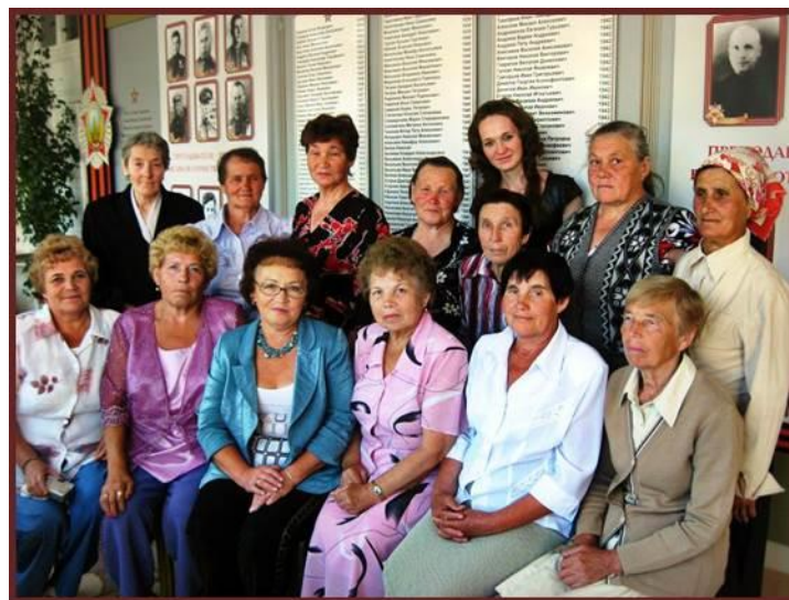
Фотографии на память