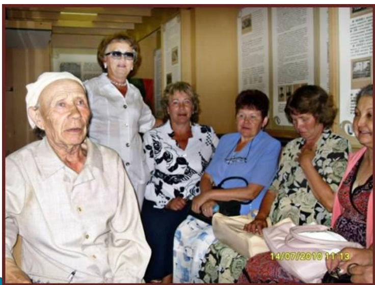
Ветеран ВОВ с выпускниками