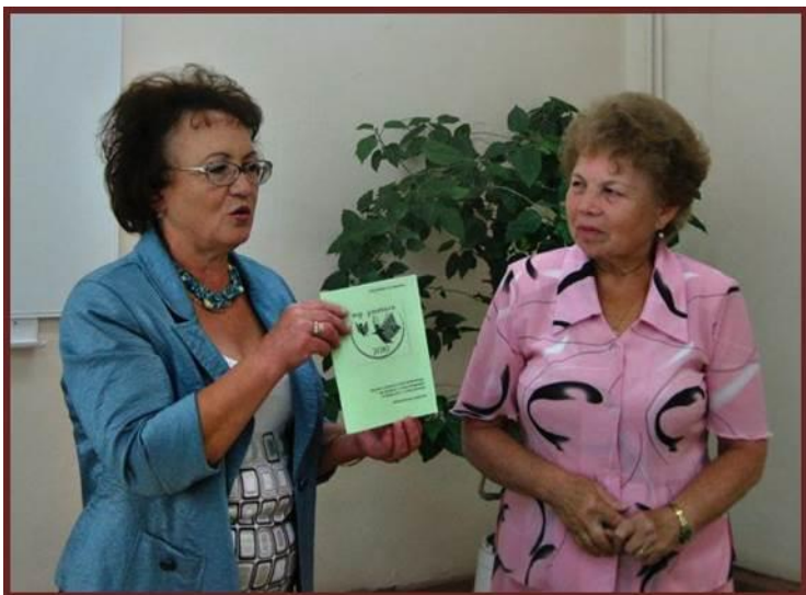
Волнующий момент презентации книги